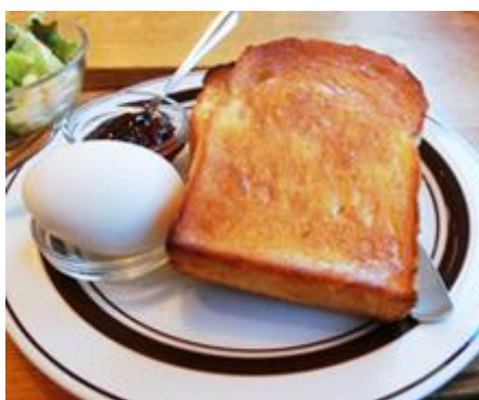
モーニング

ドリンク一杯の値段でトーストなどを朝食として食べることができます。この地域では、トーストのトッピングとしてあんこがついてくるのは定番。又、お店によっては、食パン一斤が丸ごと出てきたり、おにぎり、みそ汁、お刺身、茶わん蒸しがついてきたり……。どんどんエスカレートしていきます。