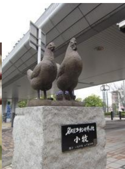
名古屋コーチン（左） 駅前モニュメント（右）