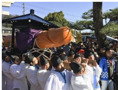
大縣神社（左）、田縣神社（右）