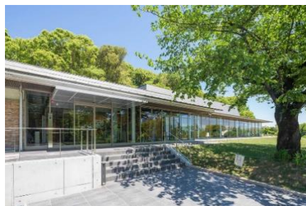
小牧山城（左）、れきしるこまき（右）