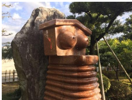
間々乳観音（愛知県観光協会ホームページより）