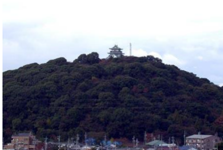
小牧山、小牧山城（小牧市ホームページより）

織田信長がはじめて城を築城し、豊臣秀吉と徳川家康の天下分け目の合戦の一つである、『小牧・長久手の戦い』の舞台となった山です。標高は86m。山全体が公園となっており、マラソンコースとしても活用できます。又、山の頂上には小牧山城が建っています（内部は歴史館）。山の麓には、「れきしるこまき」と呼ばれる歴史館があります。